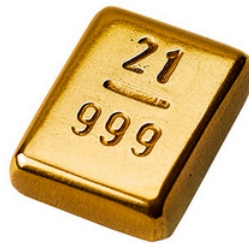
Nadja Soloviev – 21G – or fin, ficelle – 1,8 x 1,3 x 0,5 cm – 2018

Öffnungszeiten: Dienstag bis Sonntag: 12.00 > 18.00